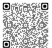
ヘルプマークに関する 熊本市役所ホームページ