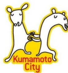
熊本市障がい者サポーター制度シンボルマーク